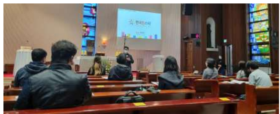
▲ 서울 연희동성당 자모회 소개특강