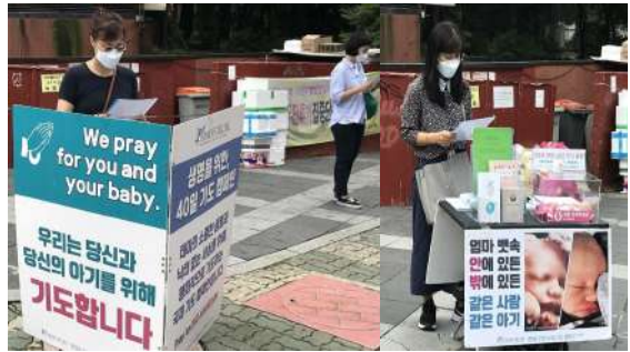
▲ 생명을 위한 40일 기도 참가