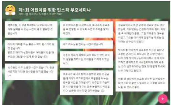
▲ 제1회 부모세미나