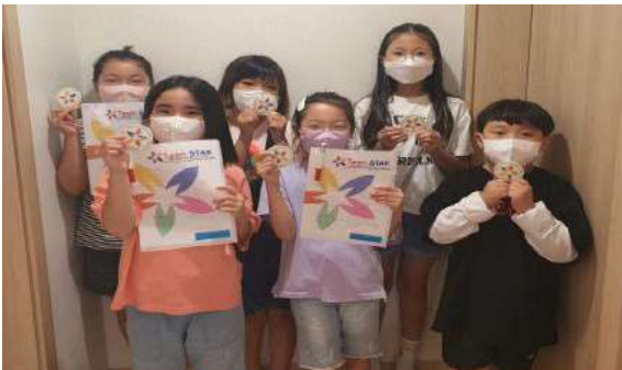
▲ 구미김천팀, 어린이를 위한 틴스타