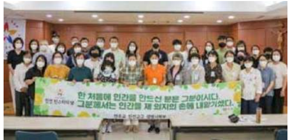
▲ 제1회 인천 틴스타 교사의 날