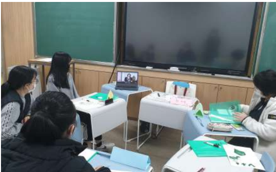
▲ 대구 효성여자고등학교, 여성을 위한 틴스타