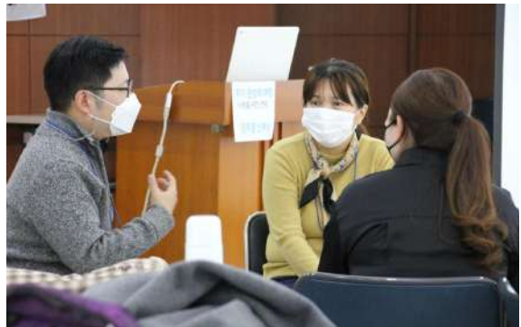
▲ 183차 인천 교사양성워크숍