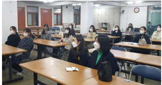
▲ 부산 민락 성당 자모회 소개특강