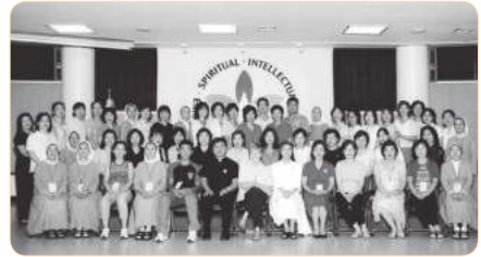
2004년 지도자과정 워크숍(대구)