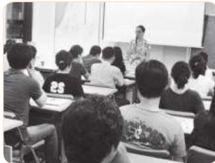
2005년 지도자과정 워크숍(제주)