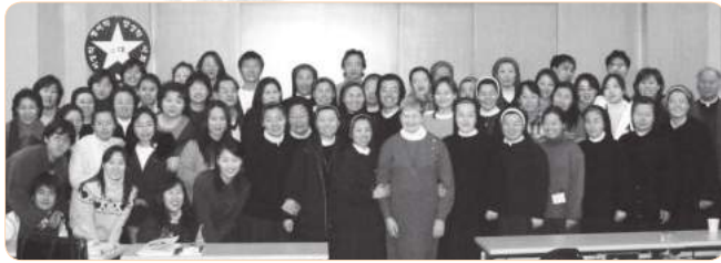
2004년 지도자과정 워크숍(서울)