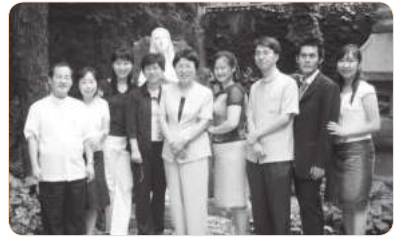
2004년 1차 전국교사모임