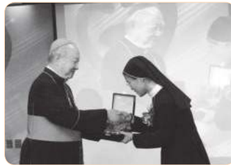
2010년 생명의 신비상 수상