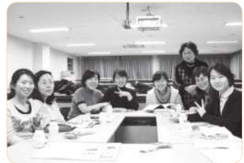
2007년 경희대학교 틴스타 수업