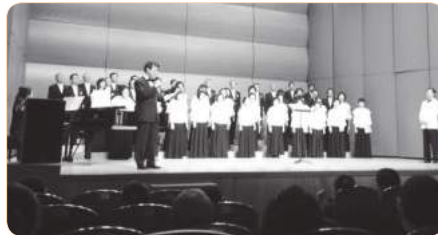
2012년 "한국틴스타와 함께하는 음악회"