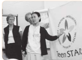
2006년 한국틴스타 로고가 국제틴스타 로고로 채택