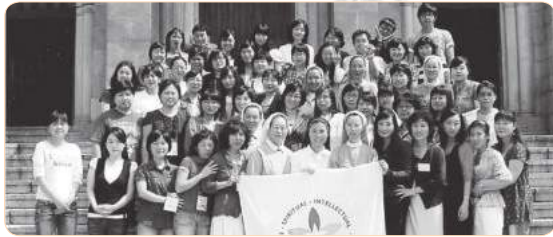
2008년 지도자과정 워크숍(인천)