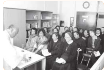
2012년 사무실 확장 및 축복식