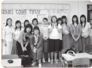
2004년 동명 여자고등학교 틴스타 수업