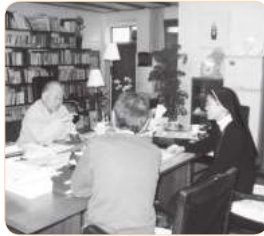
2004년 틴스타 로고 공모심사