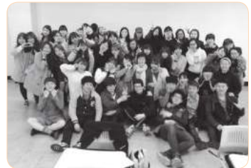
2013년 부산 가톨릭대학교 틴스타 수업