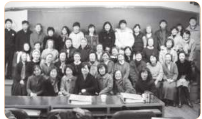
2006년 지도자과정 워크숍(광주)