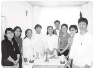
2005년 가톨릭회관으로 사무실 이전