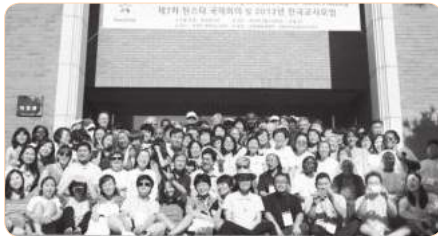
2012년 제7차 틴스타 국제회의의 한국개회