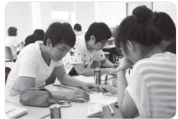
2011년 대구 가톨릭대학교 틴스타 수업