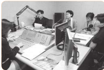
2006년 평화방송 한국틴스타 소개 및 홍보