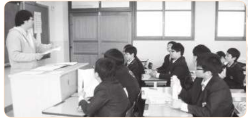
2008년 인천 동방중학교 틴스타 수업