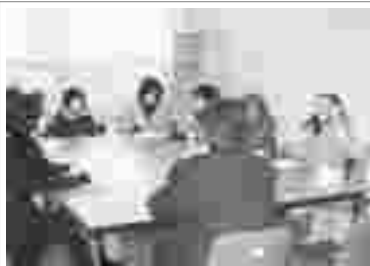
2011년 대구지부 정기총회

틴스타 대구지부는 2011년 2월 10일 교구 별관에서 지도신부님이 참석하신 가운데 정기총회를 열었다. 워크숍 직후 새내기 젊은 교사들도 참석하여 장래가 기대된다. 2010년 재정보고와 2011년도의 계획을 세웠으며 미래의 틴스타 대구지부의 방향과 지금까지의 미흡했던 부분들을 나누었다. PBC 대구평화방송 라디오 '오늘이 축복입니다'에 틴스타가 소개되었고, 2월 15일부터 18까지 틴스타 워크숍이 대구교구청에서 있었다.(대구지부 이승현 010-3823-9007)