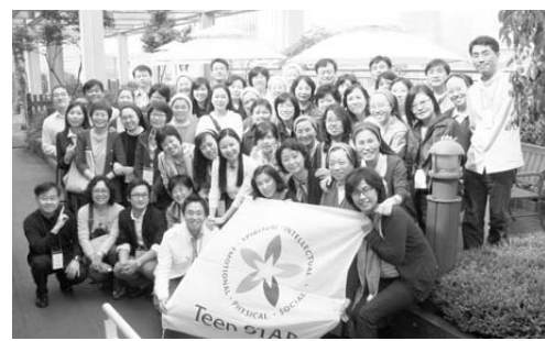
한자리에 모인 한국틴스타 교사 찰칵-