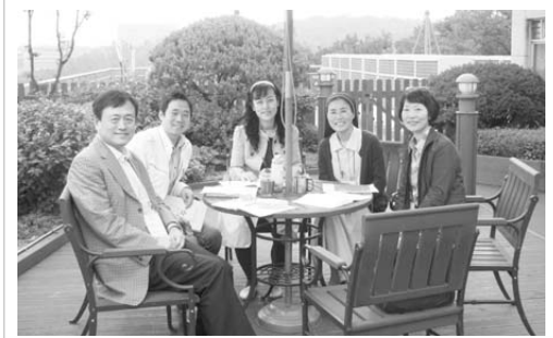
그룹 나눔 중 잠시 쉬어가며-