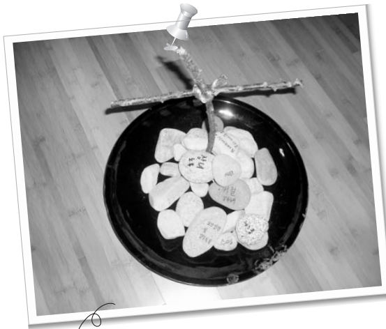
피정 참가자들이 내려놓은 마음의 짐들

이 작은 시작이 지난 11월 초에 제주도에서도 진행될 수 있었다. 치유 프로그램의 특성상 소수의 인원으로만 진행되는 아쉬움이 있으나 이렇게 하느님의 구원 사업은 조용히 번져나가고 있다. 그리고 내년에도, 후년에도 이 치유의 은혜가 세상 구석구석에 비추어 지기를 기도한다.