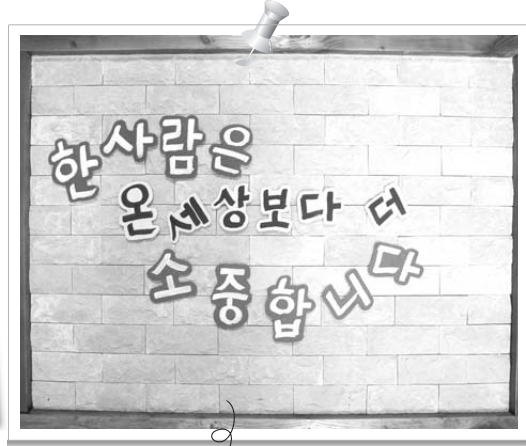
화해 피정(낙태 후 치유 프로그램)의 부제