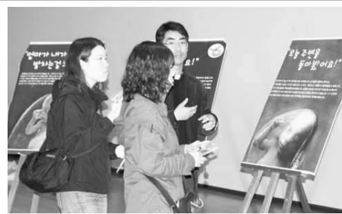
청년들에게 생명의 소중함을 전하고 있는 국제량 신부