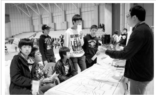
틴스타 홍보 부스를 방문한 호기심 가득한 청소년들