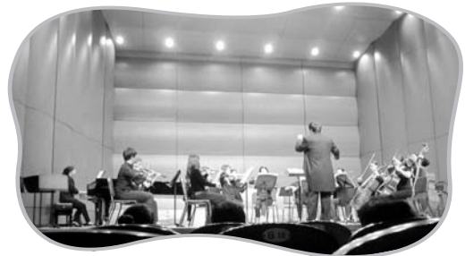
한동일 지휘자와 보엠 챔버 앙상블