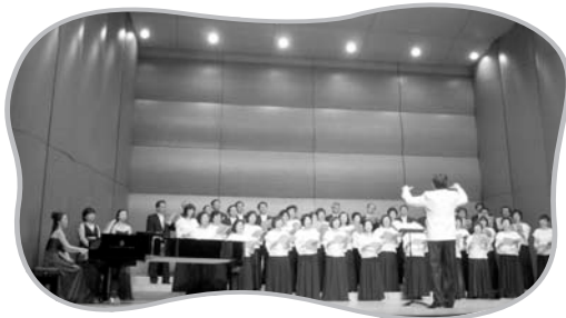
끈꾸오레 합창단 (Con Cuore- '영혼을 담아 전한다' 는 뜻)

9월 9일(일) '함께하는 음악회'가 서울 광진구에 소재하는 나루아트센터에서 열렸다. 우리에게 친숙한 클래식 음악과 가곡으로 꾸며진 음악회는 선영철 지휘자를 비롯한 60여 명의 음악인이 출연하였고 500여 명의 관객이 함께 자리하여 성황리에 끝났다. 이번 공연은 단순히 문화예술 차원을 넘어서, 우리 사회에 생명문화를 보다 확산시키고자 하는 지향으로 2013년에 맞이하는 한국틴스타 10주년 기념행사의 서막이라는 의미를 담고 있다.